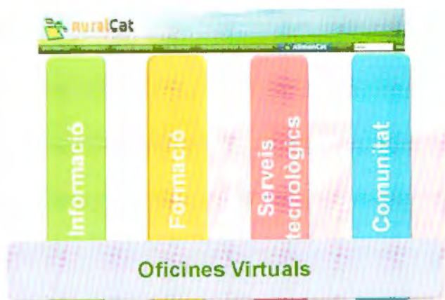
Figura 1. Els pilars de RuralCat.

Després de valorar el funcionament de les oficines virtuals, es va posar de manifest que hi ha molts professionals, vinculats als àmbits als quals dona servei el portal, que per les seves característiques més accessòries no estan ni representats ni poden ser usuaris d'aquests espais temàtics que són les oficines virtuals, malgrat que donen serveis complementaris als seus usuaris i en ocasions a usuaris de més d'una oficina virtual.