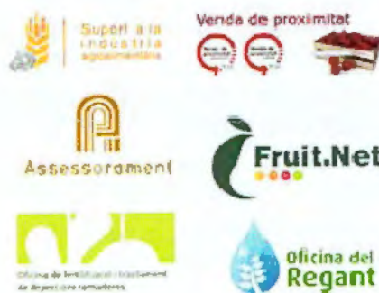
Figura 2. Oficines virtuals a RuralCat.

Després de valorar el funcionament de les oficines virtuals, es va posar de manifest que hi ha molts professionals, vinculats als àmbits als quals dona servei el portal, que per les seves característiques més accessòries no estan ni representats ni poden ser usuaris d'aquests espais temàtics que són les oficines virtuals, malgrat que donen serveis complementaris als seus usuaris i en ocasions a usuaris de més d'una oficina virtual.